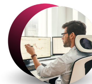
BUSINESS CENTRAL FLYING START