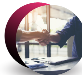
BUSINESS CENTRAL FLYING START

Dynamics 365 Business Central je sada dostupan na jednostavan i brz način, po pristupačnim uslovima i savršeno pripremljenim ERP paketima po meri vašeg poslovanja .