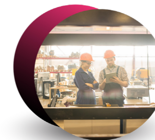
BUSINESS CENTRAL FLYING START